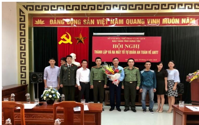
Đại diện lãnh đạo Phòng Xây dựng phong trào toàn dân bảo vệ An ninh Tổ quốc và Phòng An ninh chính trị nội bộ, Công an tỉnh Hưng Yên tặng hoa chúc mừng ra mắt Tổ tự quản an toàn về ANTT tại Bảo tàng tỉnh Hưng Yên

Trước tình hình đó, quán triệt các văn bản chỉ đạo của Đảng, Nhà nước, Bộ Công an về công tác dân vận; Đảng ủy, Giám đốc công an tỉnh đã ban hành nhiều nghị quyết chuyên đề, chương trình, kế hoạch thực hiện công tác đảm bảo ANTT trên địa bàn tỉnh gắn với tổ chức thực hiện tốt phong trào thi đua “Dân vận khéo” trong toàn lực lượng