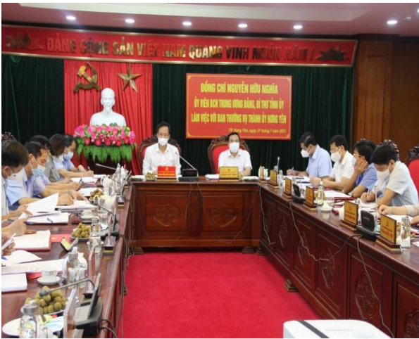
Đồng chí Bí thư Tỉnh ủy Nguyễn Hữu Nghĩa làm việc với Ban Thường vụ Thành ủy Hưng Yên

Từ ngày 26/7 - 08/9/2021, đồng chí Nguyễn Hữu Nghĩa, Ủy viên BCH Trung ương Đảng, Bí thư Tỉnh ủy đã có các buổi làm việc với Ban Thường vụ các huyện ủy, thành ủy về tình hình phát triển kinh tế - xã hội, công tác xây dựng Đảng và hệ thống chính trị trên địa bàn các huyện, thành phố. Bản tin Dân vận Hưng Yên đăng tải một số hình ảnh trong các buổi làm việc của đồng chí Bí thư Tỉnh ủy Nguyễn Hữu Nghĩa với Ban Thường vụ các huyện ủy, thành ủy.