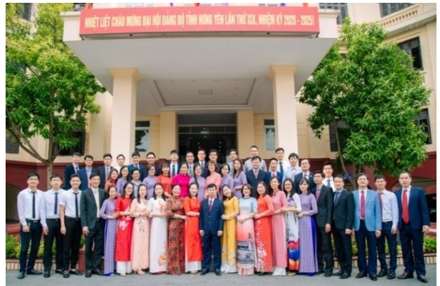
Tập thể cán bộ, công chức Sở Kế hoạch và Đầu tư Hưng Yên

Công tác dân vận chính quyền tại Sở Kế hoạch và Đầu tư được triển khai, thực hiện gắn với đẩy mạnh cải cách hành chính, trọng tâm là rà soát chuẩn hóa, cắt giảm thủ tục hành chính và tăng cường ứng dụng công nghệ thông tin trong việc tiếp nhận, giải quyết thủ tục hành chính theo cơ chế một cửa, một cửa liên thông. Những năm qua, công tác cải cách thủ tục hành chính và ứng dụng công nghệ thông tin luôn được Sở Kế hoạch và Đầu tư xác định là nhiệm vụ