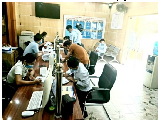
Cán bộ, công chức Bộ phận một cửa Thị trấn Như Quỳnh hướng dẫn công dân giải quyết thủ tục hành chính

Công tác cải cách hành chính của huyện đang dần đi vào nề nếp và bước đầu đã có hiệu quả tích cực, từng bước hiện đại hóa hành chính theo đúng phương châm “Chính phủ liêm chính, kiến tạo, phục vụ Nhân dân”. Các cơ quan, đơn vị, địa phương tăng cường kỷ luật, kỷ cương trong giải quyết công việc của tổ chức và công dân; tập trung triển khai xây dựng, phát triển chính quyền điện tử và áp dụng hệ thống quản lý chất