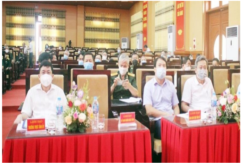
Các đại biểu dự Hội nghị tổng kết phong trào “Cựu chiến binh giúp nhau giảm nghèo, làm kinh tế giỏi” lần thứ V (giai đoạn 2016 - 2021)

Lãnh đạo, chỉ đạo công tác dân vận trong bầu cử đại biểu Quốc hội khóa XV và Hội đồng nhân dân các cấp, nhiệm kỳ 2021 - 2026; thực hiện “ mục tiêu kép ” vừa phòng chống dịch, vừa phục hồi, phát triển kinh tế, bảo đảm an sinh xã hội và đời sống Nhân dân; tổ chức các hoạt động mừng Đảng, mừng Xuân, chăm lo Tết cho Nhân dân. Lãnh đạo, chỉ đạo việc sơ kết, tổng kết các văn bản của Đảng về công tác dân vận. Tăng cường chỉ đạo nắm tình hình Nhân dân, nhất là tình hình Nhân dân trước, trong và sau Đại hội Đảng toàn quốc lần thứ XIII và cuộc bầu cử đại biểu Quốc hội