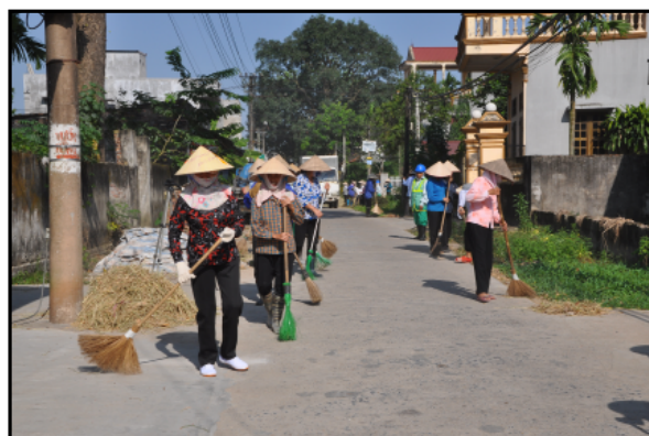
Hội viên phụ nữ xã Lạc Hồng, huyện Văn Lâm ra quân tổng vệ sinh môi trường