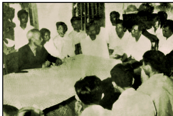
Bác Hồ làm việc với Thường vụ Tỉnh ủy Hưng Yên về sản xuất vụ mùa và chống hạn (ngày 3-7-1958)

Người nhấn mạnh: "Chủ nghĩa cá nhân là một thứ vi trùng rất độc, là bệnh chính, bệnh mẹ sinh ra trăm thứ bệnh nguy hiểm khác" và Người chỉ ra 10 loại bệnh nảy sinh từ chủ nghĩa cá nhân cần nhận diện và phòng chống: Bệnh quan liêu, bệnh tham lam, bệnh lười biếng, bệnh kiêu ngạo; bệnh "hữu danh, vô thực" (làm ít nhưng báo cáo, khoe