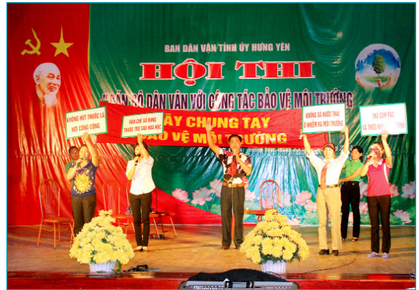
Hội thi công tác dân vận với bảo vệ môi trường tỉnh Hưng Yên năm 2014

T hực hiện Nghị quyết số 02 - NQ/TU ngày 10/5/2011 của Ban chấp hành Đảng bộ tỉnh khóa XVII về chương trình xây dựng nông thôn mới tỉnh Hưng Yên giai đoạn 2011 - 2020 định hướng đến năm 2030; Nghị quyết số 11 - NQ/TU ngày 21/3/2013 của Ban Thường vụ Tỉnh ủy về tăng cường quản lý, xử lý tình trạng ô nhiễm môi trường trên địa bàn tỉnh. Những năm qua, Ban Dân vận tỉnh ủy đã ban hành các văn bản để triển khai thực hiện như: Hướng dẫn số 12 - HD/BDVTU về công tác dân vận thực hiện 3 nghị quyết chuyên đề của Ban Thường vụ Tỉnh ủy, trong đó có Nghị quyết số 11- NQ/TU; thường xuyên phối hợp với Sở Tài nguyên và Môi trường đẩy mạnh việc thực hiện Chương trình phối hợp số 02 - CTPH/BDVTU - TN & MT về phối hợp hành động bảo vệ môi trường phục vụ phát triển bền vững; đã phối hợp với Chi cục Bảo vệ Môi trường thuộc Sở Tài nguyên và Môi trường tổ chức 05 hội nghị tuyên truyền về công tác bảo vệ môi trường cho trên 800 cán bộ hội viên, đoàn viên và nhân dân tại các xã Phú Thịnh, huyện Kim Động; thị trấn Ân Thi, huyện Ân Thi; xã Quang Hưng, huyện Phù Cừ; xã Trung Dũng huyện Tiên Lữ; thôn Hành Lạc, thị trấn Như Quỳnh, huyện Văn Lâm và sinh viên trường Cao đẳng Y tế Hưng Yên; tại hội nghị Ban Dân vận Tỉnh ủy đã phát hàng trăm tờ rơi về công tác dân vận trong tuyên truyền bảo vệ môi trường cho các đại biểu dự hội nghị.