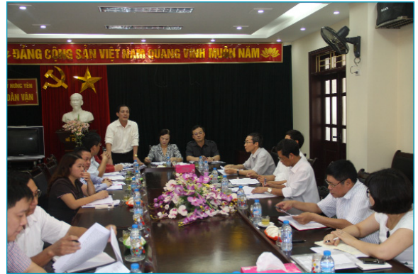
Ban Dân vận Tỉnh ủy đón và làm việc với Đoàn khảo sát của Ban Dân vận Trung ương về công tác dân vận của chính quyền

Đ ảng ta luôn xác định công tác dân vận là nhiệm vụ có ý nghĩa chiến lược đối với sự nghiệp cách mạng của đất nước; là điều kiện quan trọng bảo đảm sự lãnh đạo của Đảng, củng cố và tăng cường mối quan hệ máu thịt giữa Đảng, Nhà nước với nhân dân. Bài báo “Dân vận” của Bác Hồ viết năm 1949, khi đề cập đến vấn đề “Ai phụ trách dân vận”, Bác đã chỉ rõ: “Tất cả cán bộ chính quyền, tất cả cán bộ đoàn thể và tất cả hội viên của các tổ chức nhân dân (Liên Việt, Việt Minh, v.v...) đều phải phụ trách dân vận”. Thấm nhuần tư tưởng của Bác Hồ, những năm qua, Ban dân vận các cấp trong tỉnh đã thực hiện tốt vai trò tham mưu giúp cấp ủy lãnh đạo, chỉ đạo phổ biến, quán triệt triển khai thực hiện các chỉ thị, nghị quyết của trung ương, của tỉnh về công tác dân vận như: Nghị quyết số 25-NQ/TW, ngày 03/6/2013 của Ban Chấp hành Trung ương Đảng (khóa XI) về “Tăng cường và đổi mới sự lãnh đạo của Đảng đối với công tác dân vận trong tình hình mới”; Quyết định số 217 - QĐ/TW, ngày 12/12/2013 của Bộ Chính trị khóa XI về việc ban hành quy chế giám sát và phản biện xã hội của Mặt trận Tổ quốc Việt Nam và các đoàn thể chính trị - xã hội; Quyết định số 218-QĐ/TW, ngày 12/12/2013 của Bộ Chính trị khóa XI về ban hành quy định về việc Mặt trận Tổ quốc và các đoàn thể chính trị - xã hội và nhân dân tham gia góp ý xây dựng đảng, xây dựng chính quyền; chỉ đạo