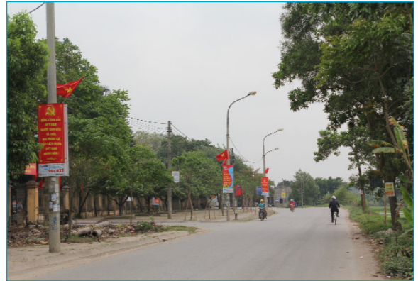
Công tác tuyên truyền về Đại hội Đảng các cấp trên địa bàn huyện Văn Giang

Huyện ủy đã tổ chức hội nghị phổ biến, quán triệt các văn bản trên đến các đồng chí Ủy viên BCH đảng bộ huyện; Thường trực