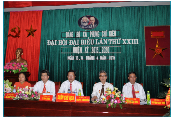
Đại hội Đại biểu Đảng bộ xã Phùng Chí Kiên lần thứ XXIII, nhiệm kỳ 2015 - 2020

Phùng Chí Kiên không là xã được chọn làm điểm Xây dựng Nông thôn mới của huyện, song Đảng ủy đã thực hiện tốt công tác dân vận trong lãnh đạo, chỉ đạo xây dựng nông thôn mới giai đoạn 2011 - 2015, định hướng đến năm 2020; phát huy sức mạnh tổng hợp của cả hệ thống chính trị, thực hiện tốt công tác dân vận để tuyên truyền, triển khai sâu rộng đến toàn thể cán bộ đảng viên và nhân dân học tập, thông qua các hội nghị từ xã đến thôn về chủ trương, chính sách của Đảng và Nhà nước, yêu cầu cấp thiết của việc xây dựng nông thôn mới trong giai đoạn hiện nay; xác định đây là nhiệm vụ, trách nhiệm của mình, nhằm mục tiêu xây dựng xã Phùng Chí Kiên có kết cấu hạ tầng kinh tế - xã hội từng bước phát triển hiện đại, có cơ cấu kinh tế và các hình thức tổ chức sản xuất hiệu quả. Đời sống vật chất, tinh thần của nhân dân ngày một nâng cao thực sự dân chủ, ổn định, giàu bản sắc văn hoá, môi trường sinh thái xanh, sạch đẹp, quốc phòng an ninh giữ vững.